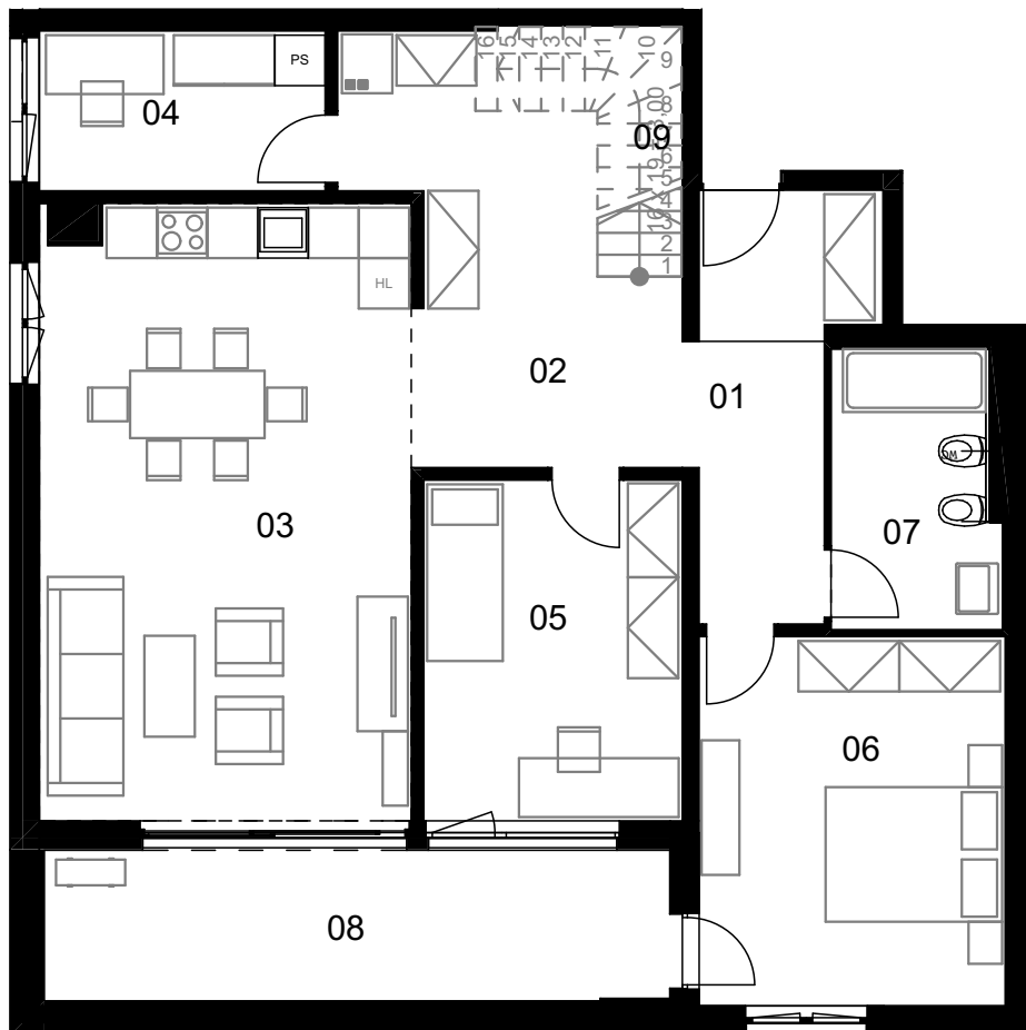
enota D M-1